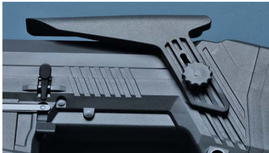
Die Bullpup-Flinte besitzt eine höhenverstellbare Wangenauflage.