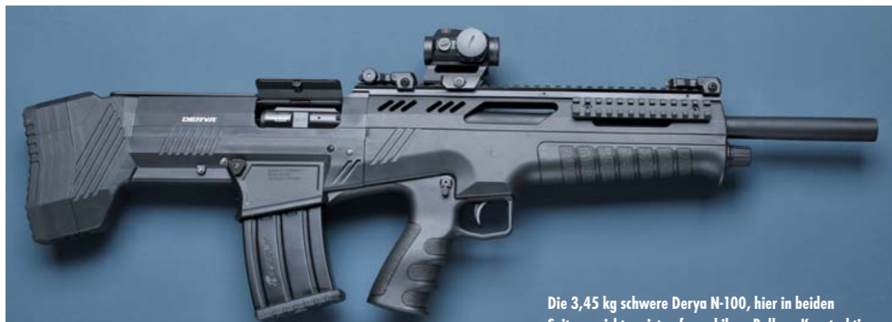
Die 3,45 kg schwere Derya N-100, hier in beiden Seitenansichten, ist aufgrund ihrer Bullpup-Konstruktion mit 50-cm-Lauf und voller, ballistischer Leistung gerade einmal 79 cm lang.