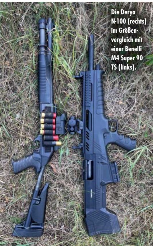
Die Derya N-100 (rechts) im Größenvergleich mit einer Benelli M4 Super 90 TS (links).