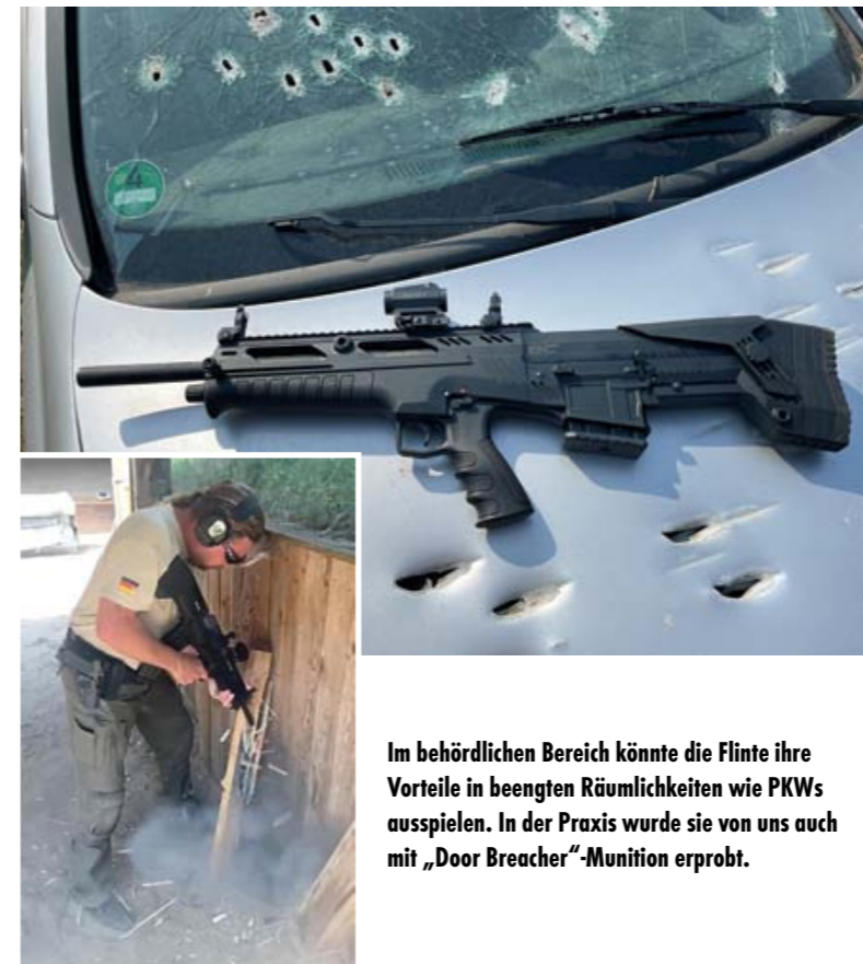
Im behördlichen Bereich könnte die Flinte ihre Vorteile in beengten Räumlichkeiten wie PKWs ausspielen. In der Praxis wurde sie von uns auch mit „Door Breacher“-Munition erprobt.

Weitere Informationen erhält man bei: Deutschland Vertrieb RUAG Ammotec GmbH, Kronacher Straße 63, 90765 Fürth, Telefon: 01805-5797797, Fax: 0180-2797797, www.ruag.com/Ammotec sowie www.deryaarms.com