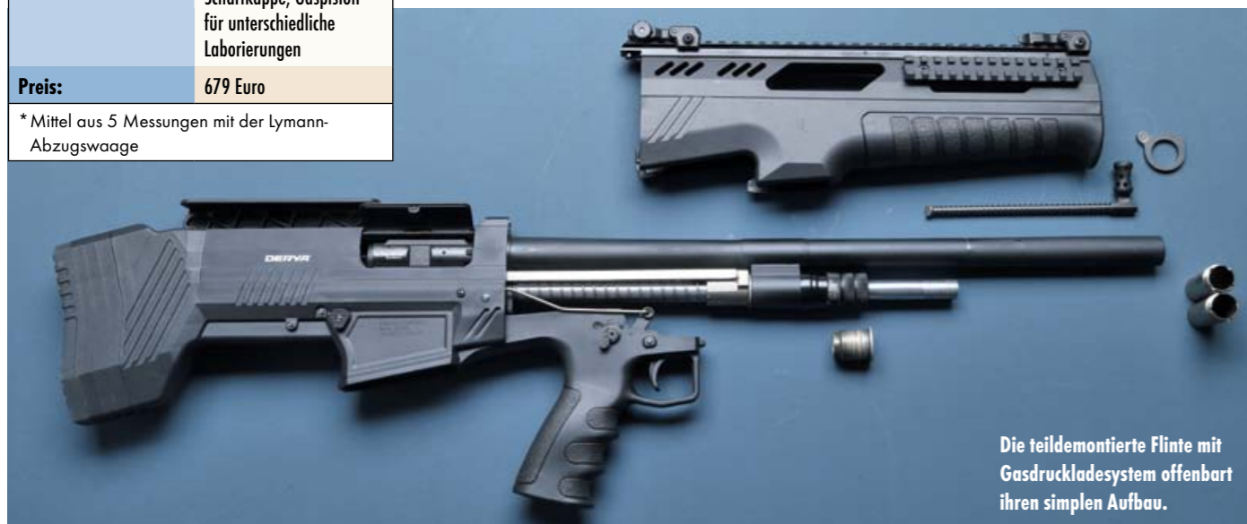
Die teildemontierte Flinte mit Gasdruckladesystem offenbart ihren simplen Aufbau.