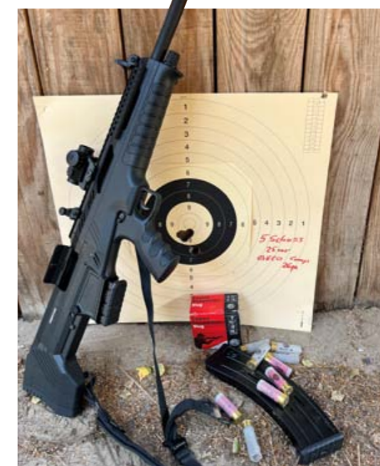
Autor Frank Thiel, Schießbilder von Baltic Shooters, bei der Arbeit mit der N-100. Sie verlangt auch aufgrund ihres geringen Gewichtes ein beherztes Zupacken im Schuss, wobei sich die Schussleistung mit Slugs durchaus sehen lassen kann.