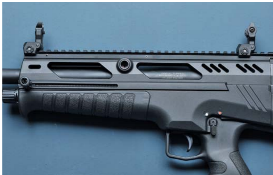
Eine klappbare Notfall-Visierung (BUIS; Back Uo Iron Sight) gehört ebenso wie Wechselchokes zum Komplettpaket der Derya N-100.